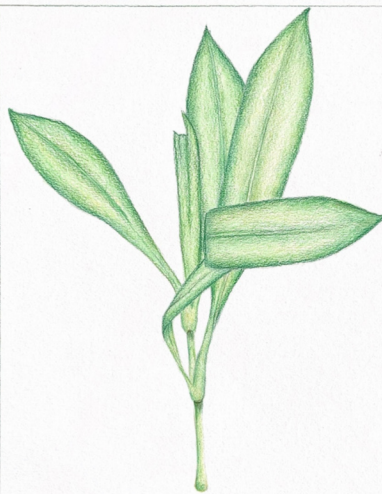
Silene Rigonfia Silene vulgaris