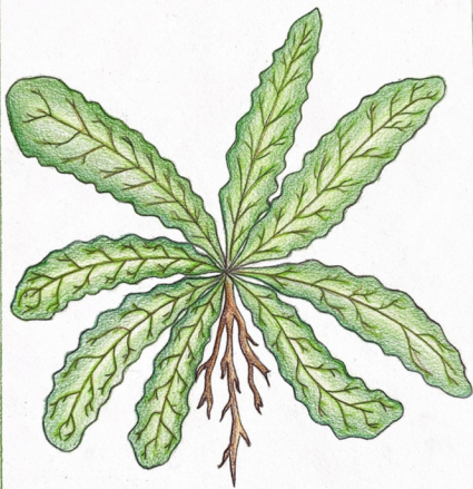
Lingua D'asino Hypochaeris radicata