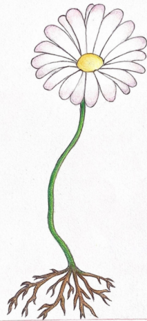
Margherita Bellis Perennis