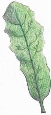
Lingua D'asino Hypochaeris Radicata