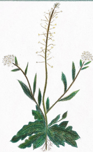
Borsa di pastore Capsella bursa-pastoris