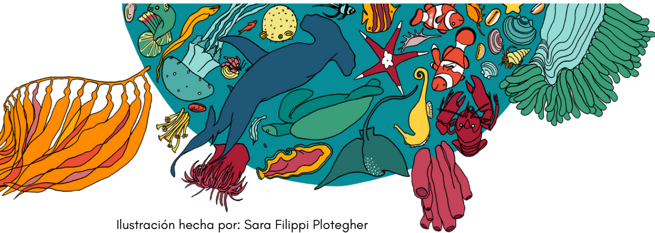
Ilustración hecha por: Sara Filippi Plotegher

La salud del de la tierra y la de las personas son una, se mantienen a través del ciclo de los alimentos, el ciclo de la vida, el ciclo de la regeneración. Somos parte de la Tierra de sus complejos procesos vivos.